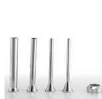
Optionals funnels and bush in stainless steel (ø 13-16-20-25-28-38)