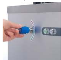
Speed adjustment tap