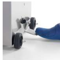
Piston pushing up