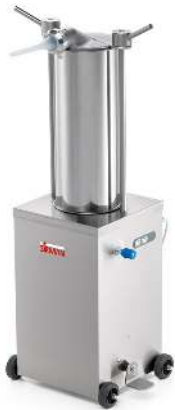
Sirman Шприцы колбасные , model IS 15 Idra :

Sirman Spa Viale dell'Industria 9/11 35010 PIEVE DI CURTAROLO (PD), Italy Tel./Fax. +39 049 9698666 / +39 049 9698688 email: info@sirman.com