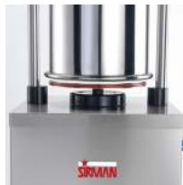
Hermetic hydraulic piston gasket