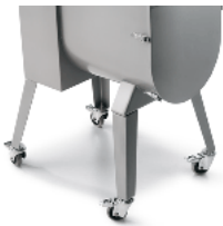
Optional legs with wheels